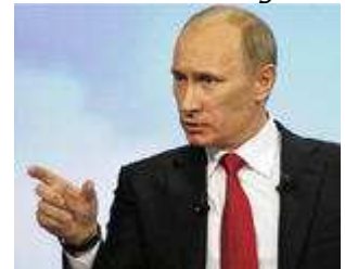
Vladimir Putins Ryssland anses ligga långt framme när det gäller kärnkraftsteknologi.