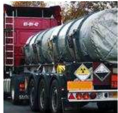
Europas uranavfallstransporter är starkt kritiserade.