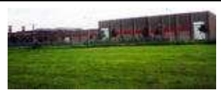
Anrikningsanläggningen i Gronau växer, eftersom kärnkraftverken behöver mer anrikat uran.