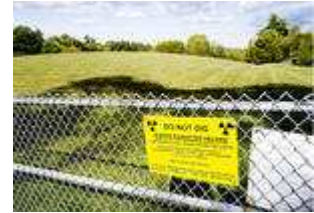
Det finns cirka 300 platser i Port Hope som identifierats som förorenade av uranindustrin.