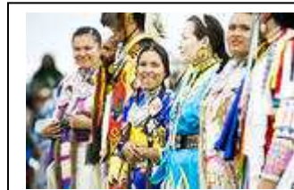
Vid pow-wow-festligheterna i Meadow Lake bär kvinnorna så här fina kläder.

Det ligger strax utanför samhället Meadow Lake och just den helgen när vi anländer pågår en årlig "pow-wow", ett färgstarkt firande och uppmärksammande av ursprungsbefolkningens traditioner med sånger, danser och maträtter.