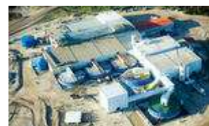
Så här kan ett urangrubbrytningsområde i Saskatchewan se ut från ovan.

– Det är sådant vi aldrig kommer att få veta. För det görs aldrig några professionella hälsoundersökningar här, som vi vågar tro på. I byn har vi inte tillräckligt med