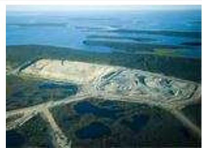
Gruvområdena i Saskatchewan, Kanada, därifrån Oskarshamns kärnkraftverk hämtat mycket uran genom åren.