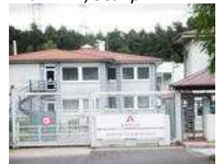
Bränsleelement till Oskarshamns kärnkraftverk ska tillverkas här i Arevas anläggning utanför den tyska staden Lingen.