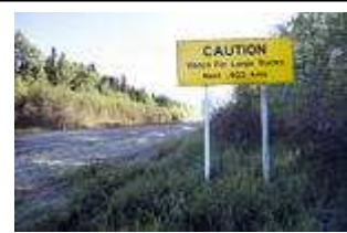
Vägskyltarna mellan Saskatoon och de glest befolkade delarna av norra Saskatchewan varnar för stora lastbilar, framför allt lastbilar som transporterar stora mängder uran från gruvområdena.

– Om någon påstår att det går att veta hur mycket uran en viss gruva serverar ett visst kärnkraftverk är