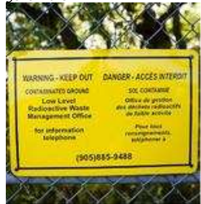
Port Hope förbereder sanering av radioaktivt avfall.