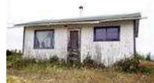
Ungefär så här ser många bostäder ut i Wollaston Lake.