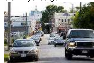
Anläggningen där uranet till OKG i årtionden har uppgraderats ligger nästan mitt i Port Hope.