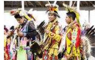
Männen kan bära på sådana här kreationer.