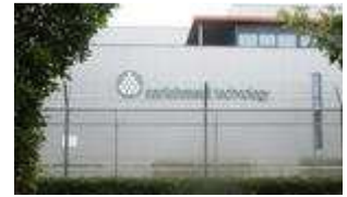
Anriksansläggningen i Almelo har många år på nacken och är omgärdad av hårda säkerhetsrestriktioner.

– Det finns ingen slutförvaring av uranavfallet från anläggningen. Och transportererna av avfallet, det utarmade uranet, härifrån till Ryssland är det värsta av allt, säger Udo Buchholtz.